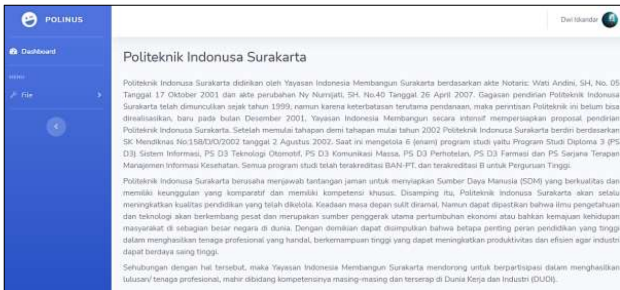
Gambar 2. Dashboard

Setelah pengguna berhasil login , akan terlihat halaman dashboard seperti di atas. Halaman ini hanya berisi sejarah singkat Politeknik Indonusa Surakarta sebagai pengantar.