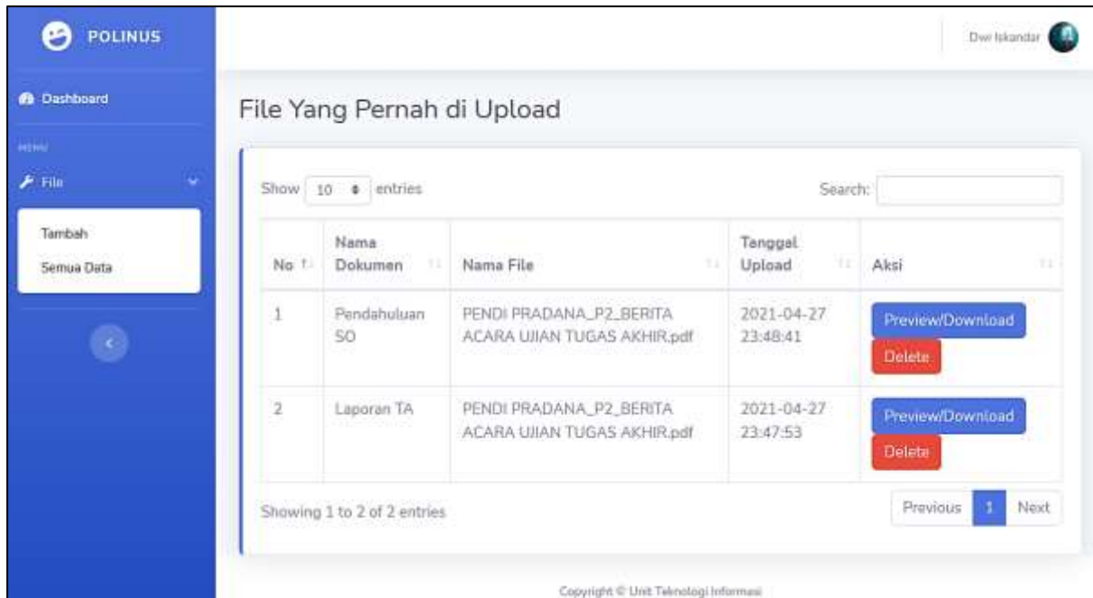
Gambar 4. Semua Data

Selanjutnya, jika Pengguna sudah menambahkan file yang diinginkan, file yang ter- upload dapat dilihat pada menu Semua Data . Halaman Semua Data terlihat seperti gambar di atas. File yang pernah diunggah diurut dari yang paling baru hingga paling lama. Pengguna hanya dapat melihat file tersebut atau men- download nya, serta men- delete jika file tersebut tidak diperlukan lagi atau terjadi kesalahan upload . Pengguna juga dapat mencari file yang diinginkan dengan mengetik nama dokumen atau nama file pada kolom search .